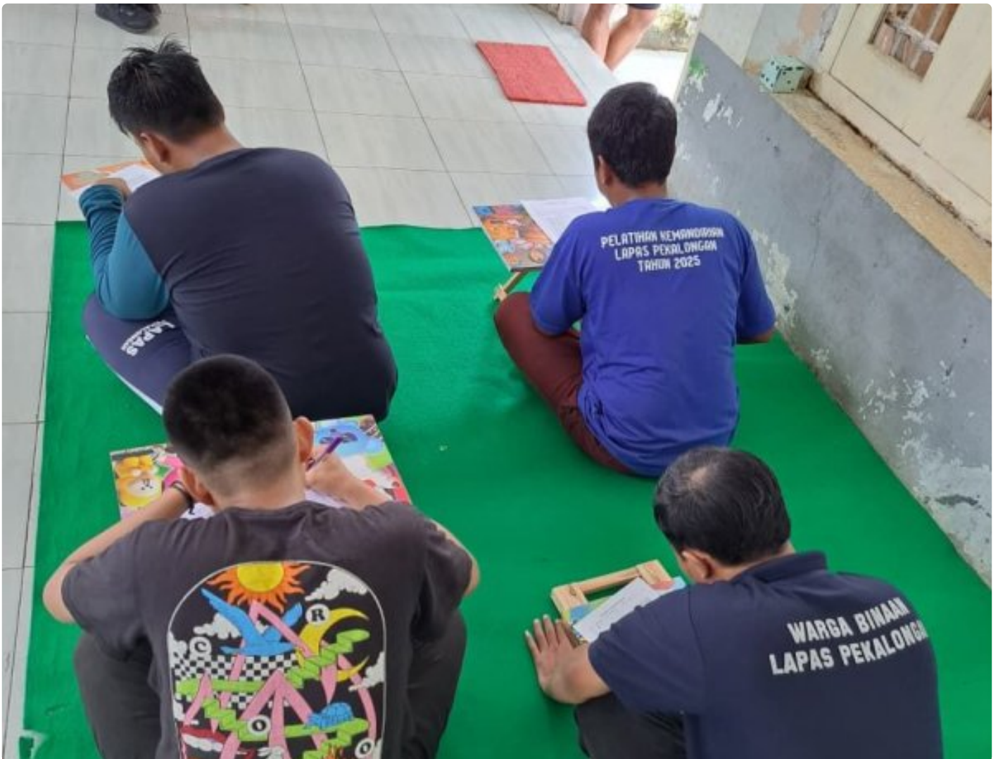
Lapas Pekalongan hadirkan Layanan Psikologis Lewat Skrining Kesehatan Jiwa

Kota Pekalongan – Lembaga Pemasarakatan (Lapas) Kelas IIA Pekalongan melaksanakan kegiatan skrining kesehatan jiwa bagi Warga Binaan sebagai upaya deteksi dini terhadap kondisi mental, Selasa (03/03/2026).